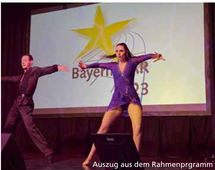
Auszug aus dem Rahmenprogramm