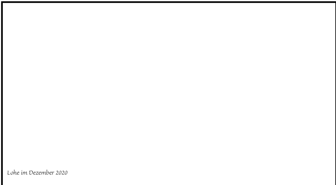
Lohe im Dezember 2020